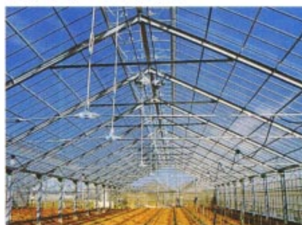
エフクリーンハウス