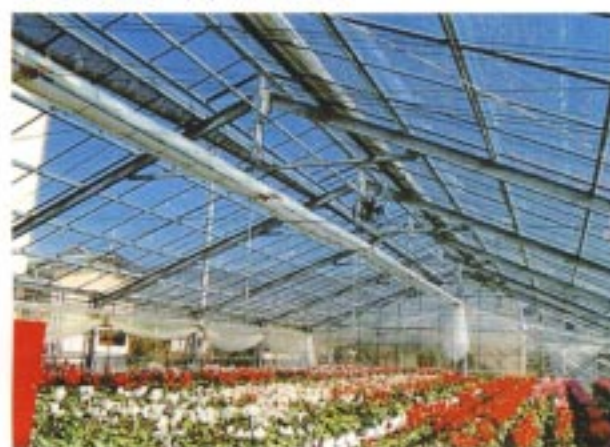
シクスライトハウス